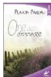
■ Platon Pardău Ore de dimineață