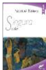
■ Nicolae Breban Singura cale