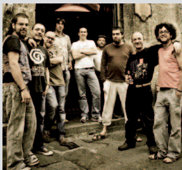
A BANDA DAS CRECHAS