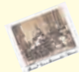
“Casa Mureşenilor” – Braşov

ROMÂNIA – BRAŞOV 12 iulie – 2 august 2009 Ediția a XV - a