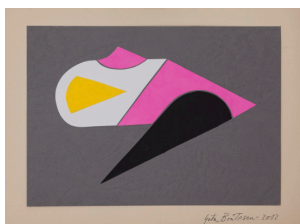
Foto: Ștefan Sava Cu permisiunea artistei și Ivan Gallery București

1975 - 1978, desen, acuarelă pe hârtie, serie de 7 bucăți, 44 x 56 cm