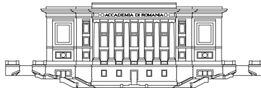
ACCADEMIA DI ROMANIA IN ROMA