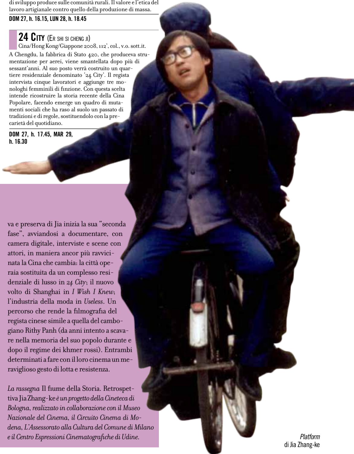
Platform di Jia Zhang-ke

Sc.: Jia Zhang-ke; Fot.: Nelson Yu Lik Wai; Int.: Yindi Cao, Hsin-i Chang, Dan-qing Chen. DOM 27, h. 22.30, LUN 28, h. 16.30