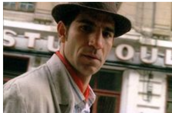
(Fabulosul destin al lui Toma Cuzin)